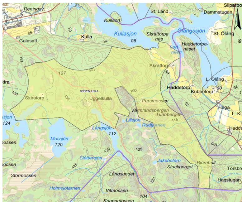
Ett område söder om Kullasjön och sydost om Brevens Bruk