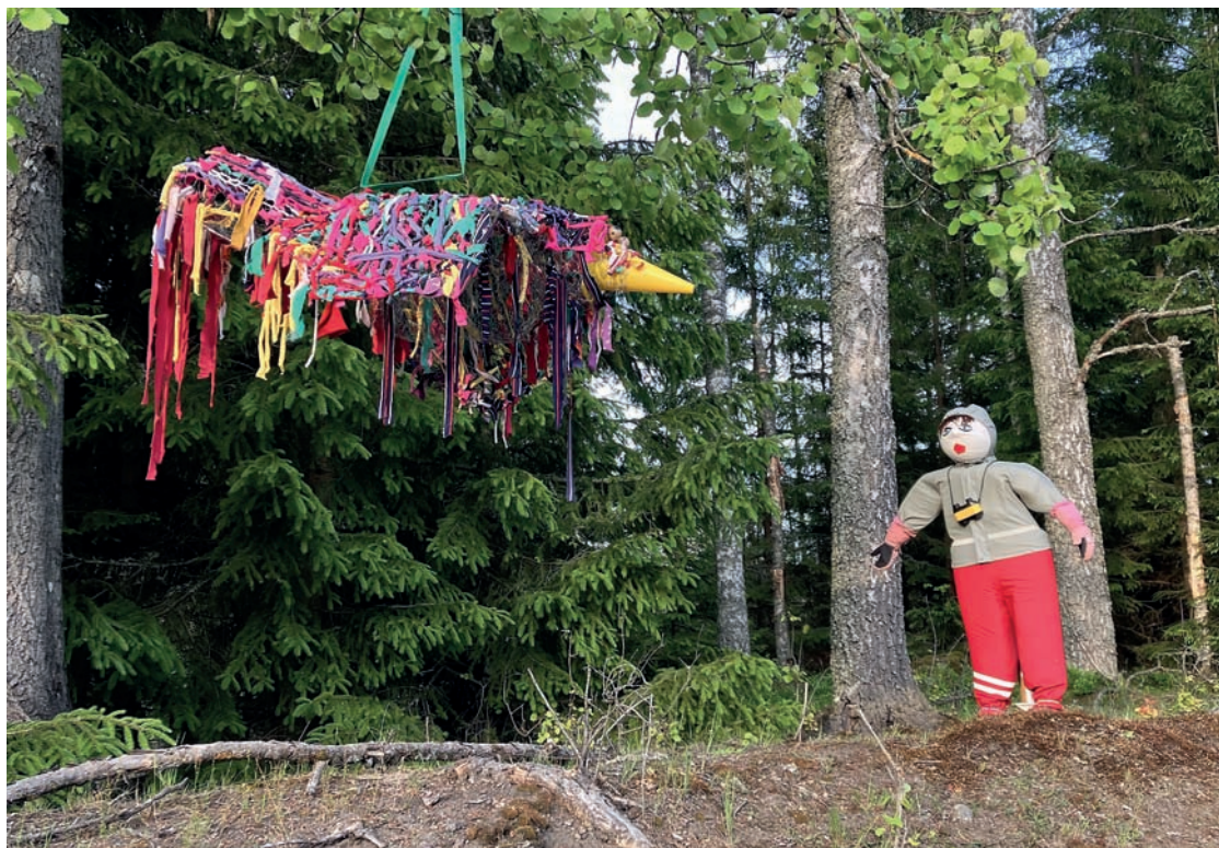
Sotterngårdens bidrag 2025.

För sjätte året i rad kommer en mängd härliga konstverk att ställas ut utefter vägen runt sjön Botaren. Rundan är 6,5 km lång med start och mål i Brevens Bruk. Vid Brevensgårdens parkering finns en skylt som visar vägen. Man tar sig runt antingen till fots, cykel, bil eller annat lämpligt fortskaffningsmedel.