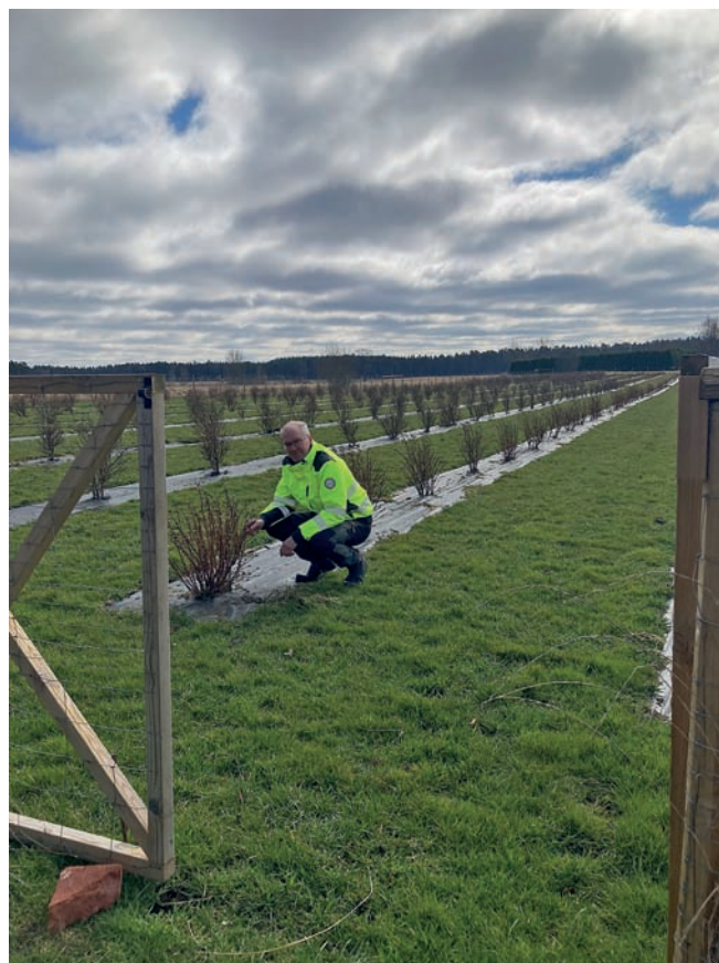
Buskarna med blåbärstry får avlånga, söta och mycket nyttiga bär som kan användas till sylt och saft. I andra delar av världen är bäret välkänt