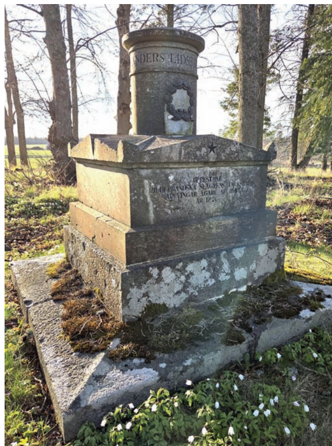
Lieutenant A. Lidstrands monument, som flyttats och numera står strax nedanför klockstapeln på Bystad herrgårdssområde. Texten är följande: UPREST AF HILDEBRANDSKA SLÄGTENS TACKSAMMA ARFVINGAR ÄGARE AF BYSTAD - ÅR 1826.