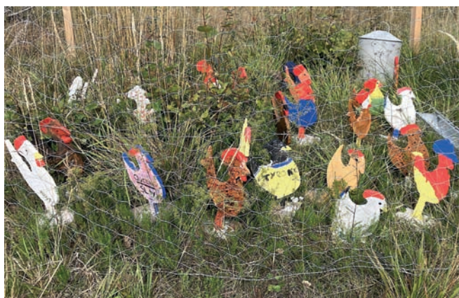
Högsjö skola byggde upp en liten hönsgård.

Som vanligt är det vi medlemmar i Skapargruppen* som jobbar med Rundan. Förutom en del gemensamma projekt har var och en av oss en eller flera egna verk som ställs ut. Dessutom är alla andra som vill vara med mycket välkomna. Förra året medverkade bland andra både Högsjö skola