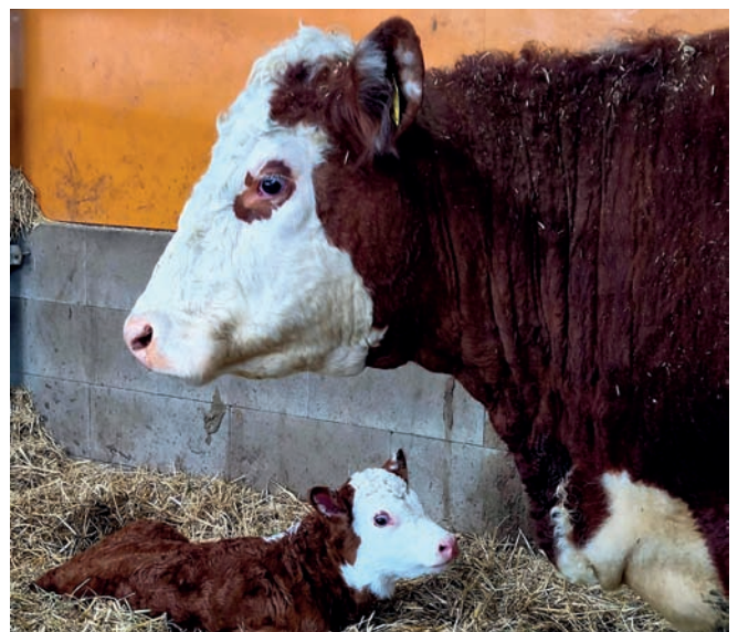
Dagen innan vårt besök på Bystad ladugård föddes den här kalven. I en annan box låg tyvärr en kalv med brutet ben som en veterinär fick gipsa.