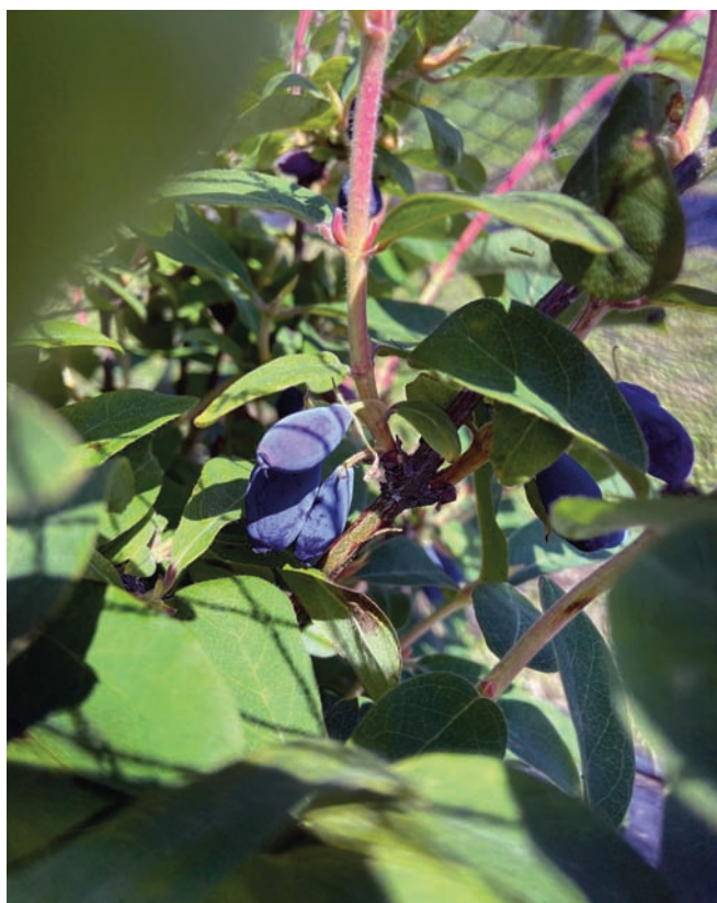
Blåbärstry – bild från Himmertry Facebooksida.