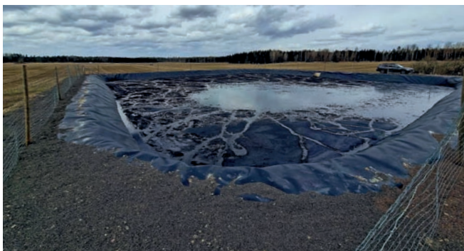
Brevens Bruk AB har nyligen anlagt en stor lagringsdamm för rötrester via biogasanläggning i Örebro. Slutprodukten ersätter tidigare års mineralgödsel.