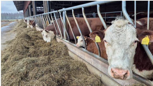
Gårdens 190 djur har fri tillgång till mat, vilket tycks uppskattas av både mammor och barn.